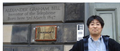
電話の発明者・ベルの生家前にて (スコットランド)

情報通信技術は日々進化しています。それを使う情報化社会はこれからの発展分野です。使い方・使われ方のいずれも今後どのように展開するか、誰も分かりません。全く未知の領域です。正解もありません。正解は私たちが作っていきます。正解作りに必要な素質は「好奇心」と「行動力」、それだけです。東北大学の自由な雰囲気のもとで、一緒に正解を作っていきますませんか?